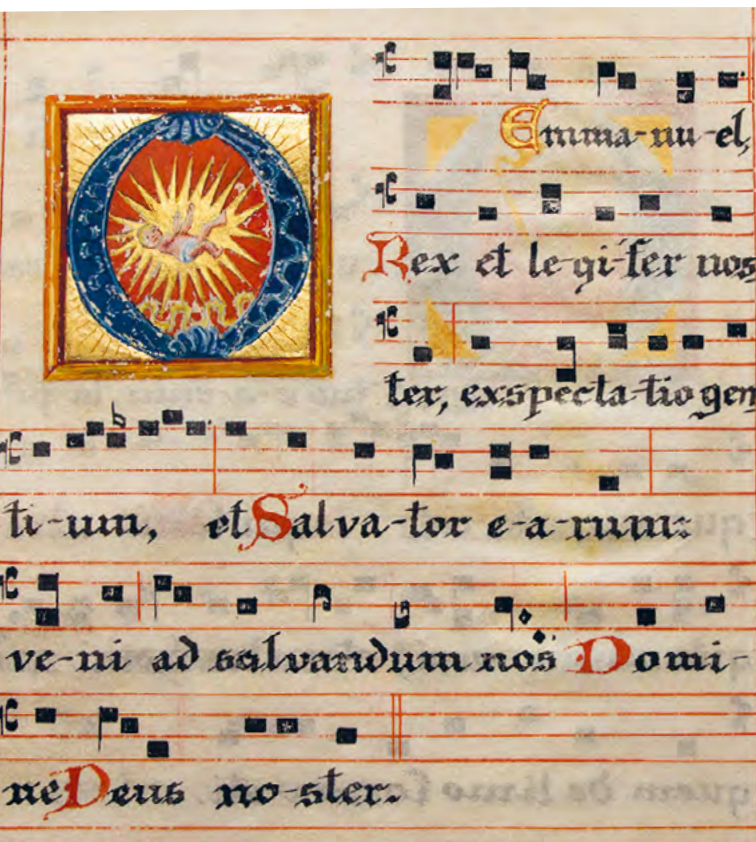
Antifon O Emmanuel aus der Abtei St. Walburg

Die O-Antifonen gehören zu den ältesten Schätzen der Adventsliturgie; ihre Ursprünge reichen bis ins 7. oder 8. Jahrhundert zurück. In ihnen verdichtet sich die ganze adventliche Sehnsucht nach der Ankunft des Erlösers – theologisch tief, poetisch kunstvoll und liturgisch feierlich zugleich. Das „O“ wirkt dabei jedes Mal wie ein Einatmen vor dem Anruf, ein Staunen vor dem Mysterium. Liturgisch markieren die Gesänge den Übergang vom Advent zur Weihnacht; die Tage der O-Antifonen bilden dazu die Schwelle. In dieser Spannung zwischen Ruf und Antwort, Sehnsucht und Erfüllung, Mensch und