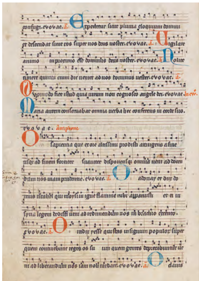
Antifon O Sapientia aus der Stiftsbibliothek Einsiedeln

Christus die Tore zum Heil. O Oriens (O Aufgang) erzählt von dem aufgehenden Licht, das die Dunkelheit vertreibt. O Rex Gentium (O König der Völker) ist ein weiterer Titel, unter dem Jesus Christus verehrt wird. Und bei O Emmanuel (O Gott mit uns) handelt es sich schließlich um die letzte Bitte um das Kommen Gottes selbst.